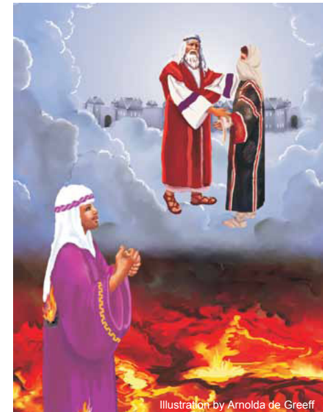
Illustration by Arnolda de Greeff

Jesús completa la sorpresa diciéndoles que el hombre rico también murió