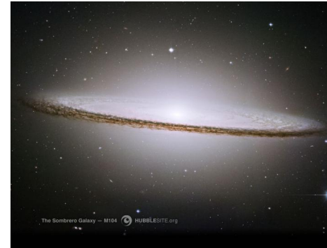
Galaxia del sombrero captada por el Hubble

Al darles estas tres parábolas Jesús quería que los cobradores de tributos y los pecadores, así como los petulantes fariseos y escribas, que creían que no tenían necesidad de arrepentimiento, supiesen que “habrá más gozo en el cielo por un pecador que se arrepiente, que por noventa y nueve justos que no necesitan de arrepentimiento” (Lucas 15:7). Pero hay más.