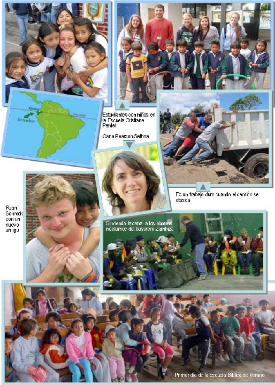
Estudiantes con niños en la Escuela Cristiana Peniel