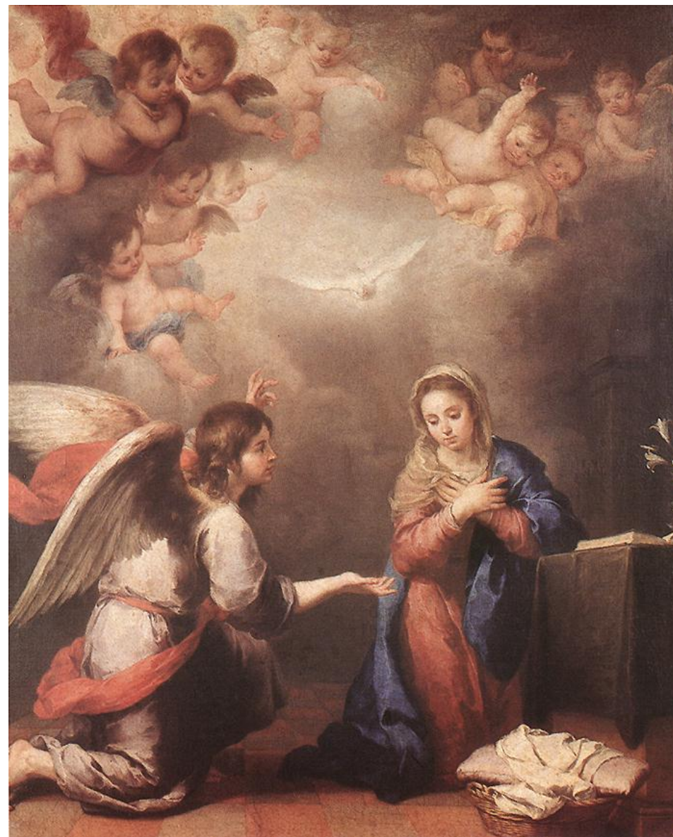
La Anunciación de Murillo - Museo del Prado, Madrid