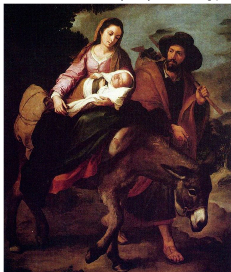
La huida a Egipto de Murillo - Museo del Prado, Madrid

Poco después de nacer fue perseguido por Herodes, ya que creía que venía a quitarle su reinado. Mandó matar a todos los niños menores de dos años, por ello un ángel del Señor se apareció a José de noche diciéndole que tomase el niño con su madre y huyeran a Egipto