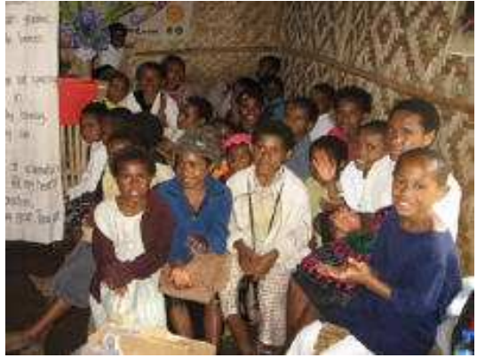
Congregación en Monte Wilhelm

La congregación ha recibido donaciones de ropa, lana, Biblias, libros y medicinas de las iglesias en Australia y del público en general. También han recibido materiales de clase para alfabetización para ayudar en la educación de la congregación. El próximo año cinco mujeres se graduarán de esta clase.