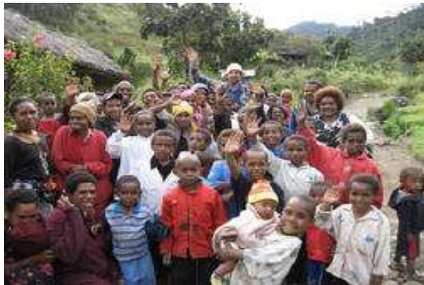
Saludos de los miembros de la congregación en Monte Wilhelm

Hay algunos aspectos positivos potenciales: una carretera mejorada, comunicación, un campo de aviación apropiado, instalacio-